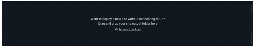
Figura 2: Colocando sua página on-line usando netlify.